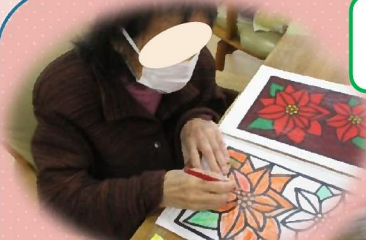
脳トレ「ポインセチア」のぬり絵