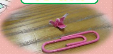
クリップより小さい折り鶴