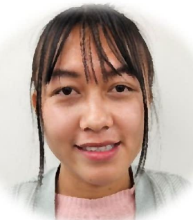
タンダーモー (呼称: モーさん)

このことに伴い、連絡ノートの御名前にひらがな表記も貼付させていただきます。ご理解のほどよろしくお願い致します。