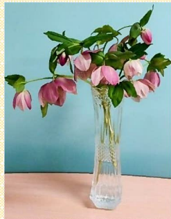
アミガサユリ(パイモ)↑